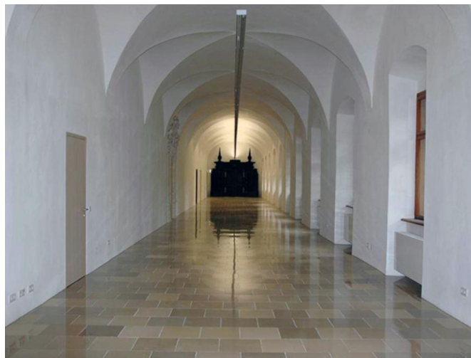
Kreuzgang im Schloss